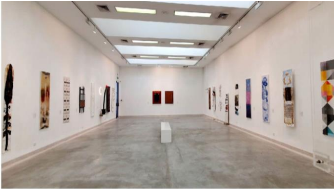
מבט בתערוכה "דברות ודברים" בית אוסוף קופפרמן בקיבוץ לוחמי הגטאות, פברואר- מאי 2022