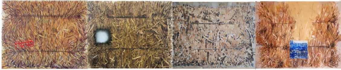
נועה לוינ חריף - מתבן 1