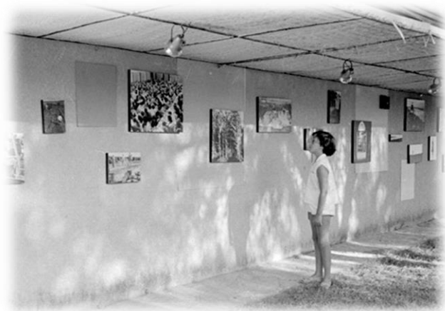
תערוכת הצילומים בחגיגת היובל 1961 מוצגת על קיר בית הילדים

עידית : כן, אני זוכרת. הייתי בכיתה ב'. הצילומים היו מודבקים על לוחות סיבית והוצגו על קיר בית הילדים שלנו מבחוץ. לנו לא נתנו להשתתף בחגיגה אך לא נרדמנו ושמענו את האורחים והמוסיקה שהתנגנה בסמוך, בחצר הגדולה.