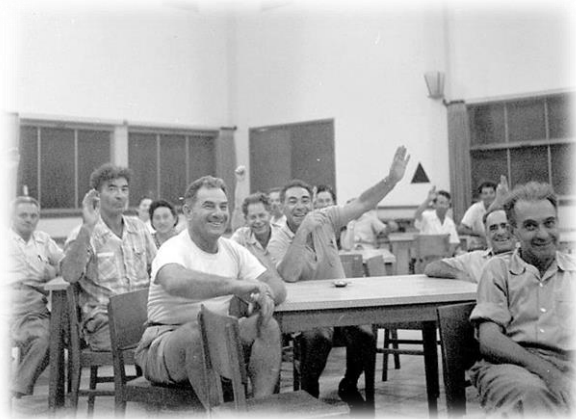
הצבעה בשיחת הקיבוץ