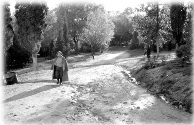
סוניה לבבי ( לבית שטוק סדן ) בדרכה לעבודה הלול חורף 1960

עידית: איפה תפסת אותו? בפלחה? גם את התמונה של סבתא אני מאוד אוהבת. הראיתי את האלבום לאנשים והם אמרו שהאווירה היוצאת מהצילומים היא שהאנשים היו מאוד מחוברים למקום, נראה שהיה להם טוב, הם נראים עובדים ושמחים, נראים שיש להם איזו משמעות וביניהם גם כוח מחבר. טוביה: גם כן וגם לא. את יודעת שהיו גם הרבה מתחים פה. וזו סבתא שלך.