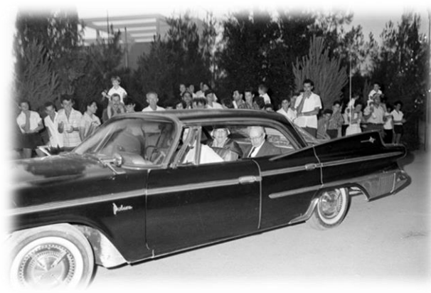
ראשת הממשלה גולדה מאיר ונשיא המדינה יצחק בן צבי ואשתו מבקרים בחגיגת היובל בקיבוץ מרחביה 1961