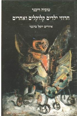
עטיפת הספר חרוזי ילדים קלוקלים איורים : יוסל ברגנר הוצאת צבעוני

עידית : כן, זו היא תחושה, מחשבה, בזמן מסוים. טוביה : בספר הזה יש הרבה שירים קשים. את מכירה את הספר שלי "חרוזי ילדים קלוקלים ואחרים"? הוא גם על המצב עכשיו בארץ. עידית : לא, מתי הוא יצא ? טוביה : יצא לפני כמה חודשים.