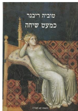
טוביה ריבנר כמעט שיחה הוצאת 'קשב' לשירה 2002

עידית : וזה התאפשר לך? טוביה : כשיצאתי לגמלאות אז זה התאפשר לי. התחלתי להוציא ספרים שאני אוהב אותם יותר מאלה שהיו קודם. עידית : אפשר להגיד שכשיצאת לגמלאות יכולת לחזור לשירה? טוביה : כן, אמנם הוצאתי מספיק ספרים גם לפני כן. אבל אלה שהוצאתי אחרי שיצאתי לגמלאות היו יותר טובים בעיני. איכשהו הייתי פטור מלחץ. עידית : כן. כנראה. טוביה : בכל זאת האוניברסיטה היא לוחצת. עידית : זה לא קל להתפצל, להיות מורה ויוצר בו זמנית. טוביה : כל התיאוריות זה נראה לי היום קצת מצחיק כל זה. אנחנו דור שמדברים את עצמנו לדעת. רוב דיבורים, כל כך הרבה, מדברים על הכל. מנתחים את הכל. עידית : ניתוח על ניתוח על ניתוח. טוביה : כן, ניתוח על ניתוח. עידית : במקום לחיות? טוביה : במקום לחיות. עידית : השיר, הוא יותר קרוב לדעתך למקור הפועם, החי? טוביה : השיר כשהוא גמור, ייתכן, ברגע שהוא עובד. אם הוא עובד אצל מישהו אז הוא אולי יותר קרוב. אבל העשייה של השיר עצמה זאת היא תמצית החיים הייתי אומר. זה הכיף. כשהוא גמור אז כבר לא. כשאני עובד עליו וצריך למצוא את הפרופורציות הנכונות, את המילים הנכונות, זה מהנה.