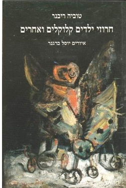
עטיפת הספר חרוזי ילדים קלוקלים איורים : יוסל ברגנר הוצאת צבעוני

עידית : כן, זו היא תחושה, מחשבה, בזמן מסוים. טוביה : בספר הזה יש הרבה שירים קשים. את מכירה את הספר שלי "חרוזי ילדים קלוקלים ואחרים"? הוא גם על המצב עכשיו בארץ. עידית : לא, מתי הוא יצא ? טוביה : יצא לפני כמה חודשים.