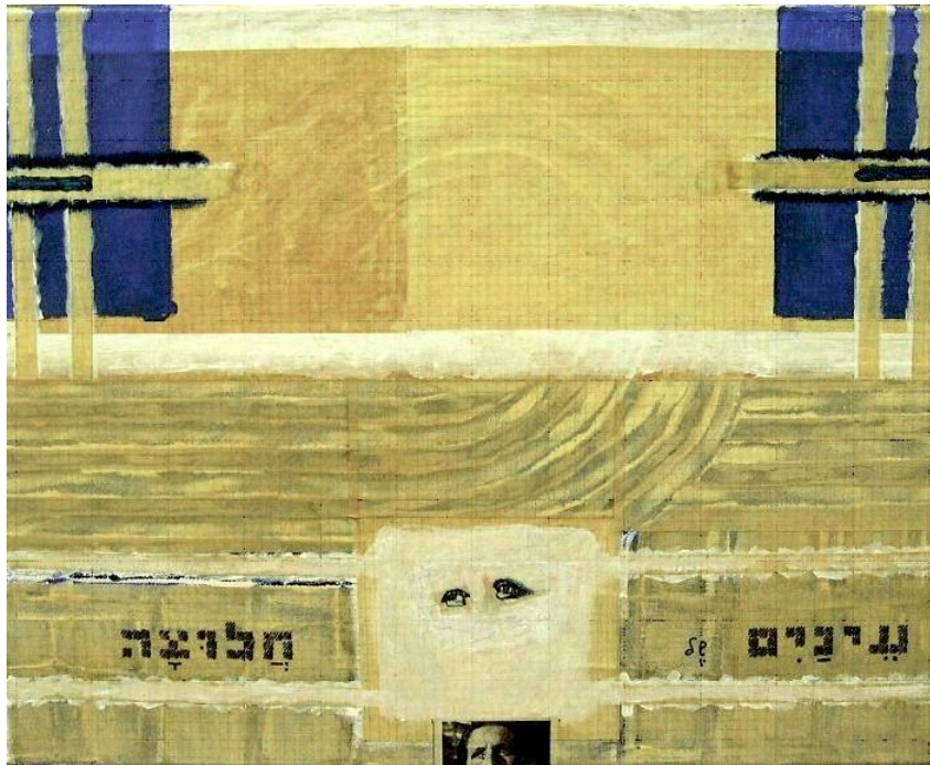
עידית לבבי גבאי, עיניים של חלוצה, 1995, טכניקה מעורבת על בד, 60X50 ס"מ

יוצא מכך שאני 'חוליה בשרשרת של מפעלי התנועה' וגדלתי 'במשטלת החינוך החדש'. ועל 'שתיקת הילדים', ואיך שיש להבינה, אנסה לענות בהמשך הדברים.