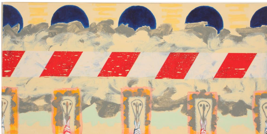
עידית לבבי גבאי, זמן בתנועה, 2008 שמן על בד 70X40 ס"מ

הדבר שמחמם לי את הלב בתמונה, זו החולצה עם המשבצות הצהובות. זו החולצה שהכי אהבתי. היה מקובל באותם הימים ש"ילדי חוץ" מביאים את בגדיהם מבית הוריהם מכאן נבע אחד השינויים בין 'ילדי החוץ' לילדי הקיבוץ. במשך תקופה ארוכה חלמתי שיתפרו לי חולצה חדשה במתפרה יחד עם כולם, ואז זה קרה. שושנה המטפלת הודיעה לי, ביום חגיגי במיוחד עבורי, שאני הולכת עם כולם למתפרה למדוד את החולצות המשובצות החדשות. לא היתה שמחה וגאה ממני ללוש ביום שישי את החולצה החדשה – כמו כולם. זה היה האישור הרשמי שלי שאני אכן חלק בלתי נפרד מקבוצת "ערבה".