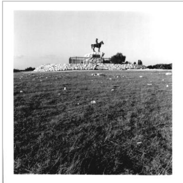
כל מקום 2000