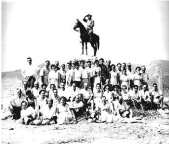
בנק אדם 1990