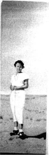
חיה גרץ קרן אמא I

הציור האחרון המוזכר בטקסט זה, הוא העדות האמנותית הראשונה הקשורה בדמותו של אלכסנדר זייד. הצייר מנחם שמי ז"ל, בן זמנו של א. זייד וידיד המשפחה, צייר את דיוקנו כשנה לאחר הרצח כמחווה אישית ומתוך הכרות וקירבה. שמי בוחר לתאר את א. זייד חובש כובע 'טמבל' חקלאי, לא הירואי, כשהבעת פניו אנושית, חמה ומתכנסת. וכך מתארת (בהיותה בת עשר), במחברתה, מיקה שילה מכפר יהושוע את האזכרה במלאת שנתיים להרצחו של אלכסנדר זייד;