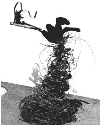
נעה מלמד 2000