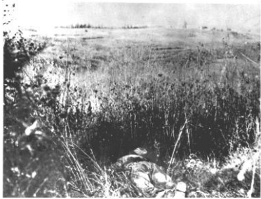
גיא רז אתר הרצח צלם: דב מייזל 1938

הצופה בשני הצילומים מבין לפתע שניתנה לו האפשרות הבלתי צפויה לעמוד ולהתבונן באותו המקום במרווח של 62 שנה. גיא רז כופה על הצופה להיות עד פעיל. הוא נדרש לחוות את רגע התגלות האירועים במהלך הזמן, ולשפוט את תהליך עיצוב הזיכרון שנתרחש בו. הבחירה בצילומים המתעדים את אתר הרצח וקברות השומרים מחדדת את המבט על המחיר הטראגי והכאב האנושי החבו בספור זה.