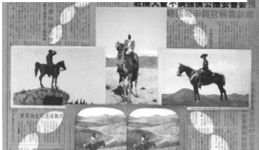
שוקה גלוטמן 4 רוכבים